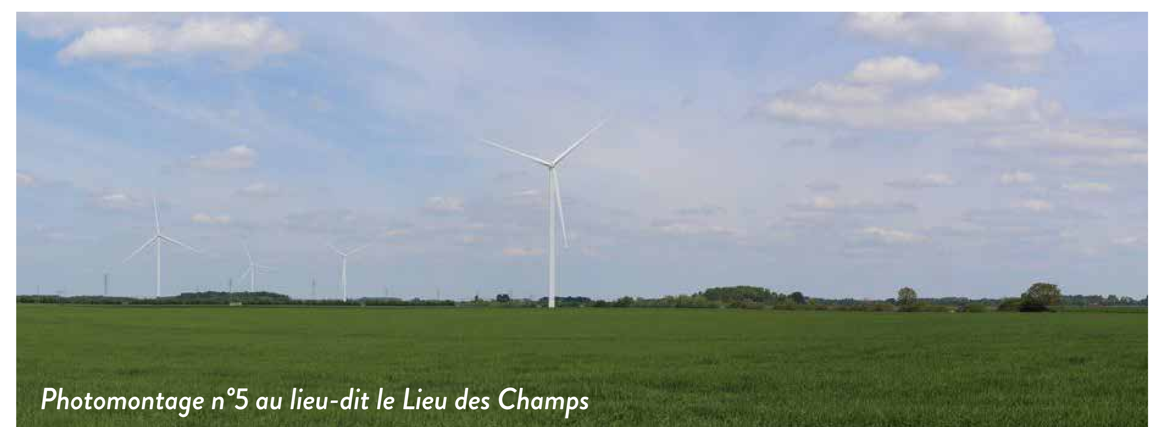
Photomontage n°5 au lieu-dit le Lieu des Champs