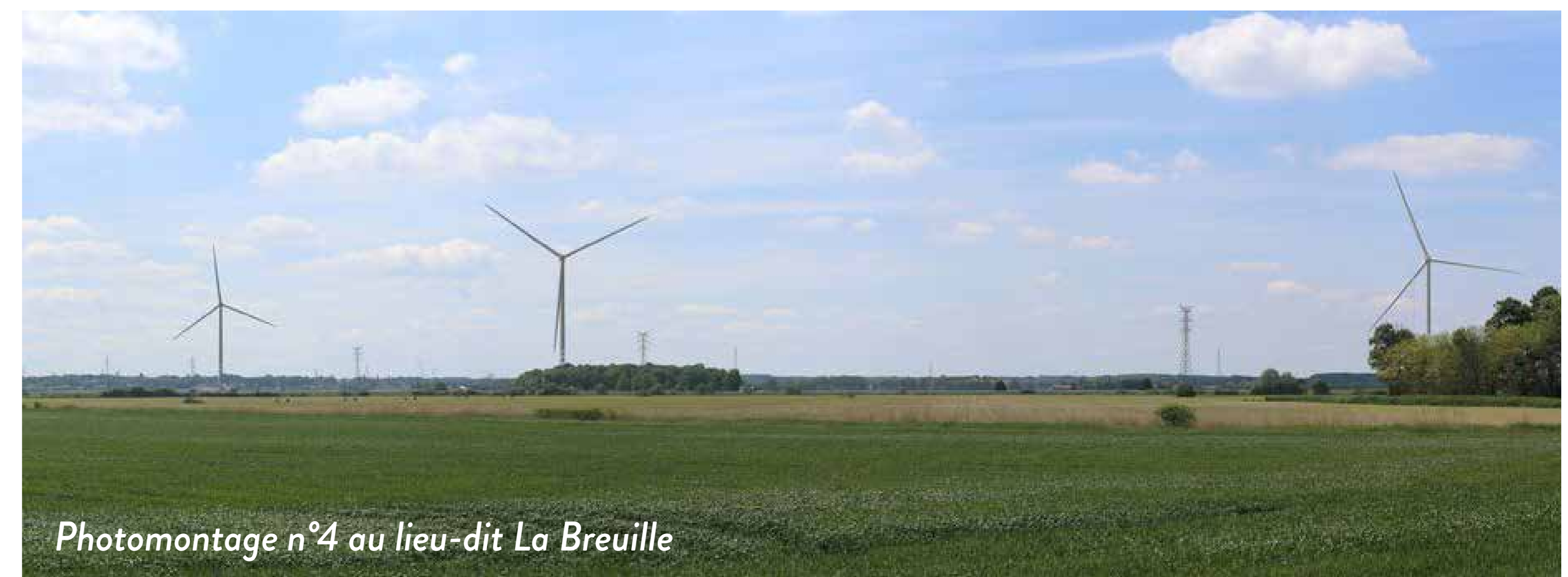
Photomontage n°4 au lieu-dit La Breuille