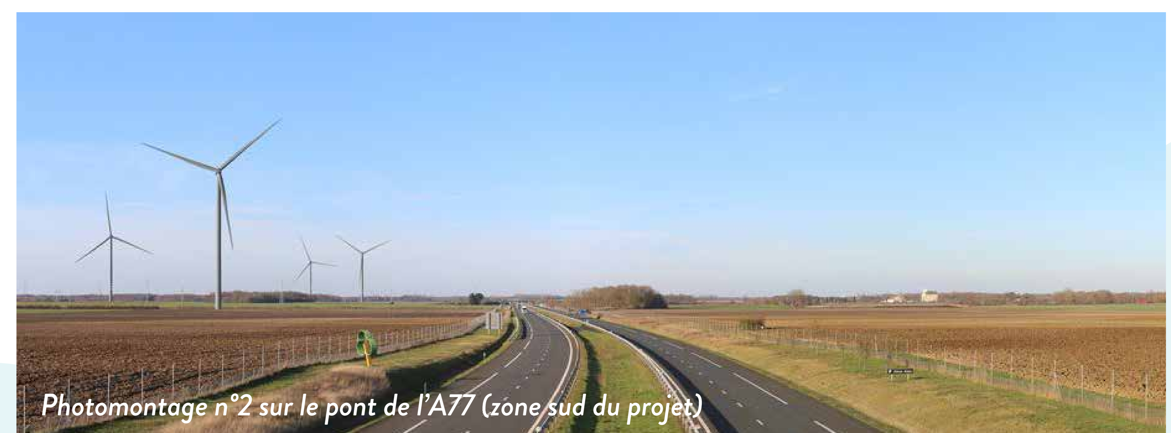
Photomontage n°2 sur le pont de l'A77 (zone sud du projet)